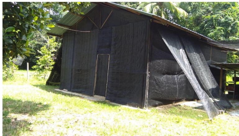
4. Membina dengan battern besi