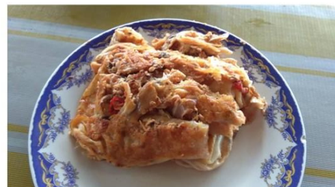
Roti Sardin Cendawan

Besar potensi jualan dan bekalan cendawan tiram kelabu ini di Malaysia dan juga kawasan tempatan anda. Bahkan menurut kajian, Malaysia memerlukan lebih 100 tan cendawan tiram kelabu sehari dan kita masih mengimport majoriti peratusan besar dari jumlah ini bagi pasaran dalam